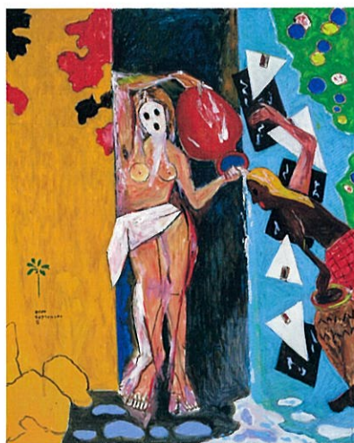
1. 《クラインの壺》| 2023年 2. 《赤い恋》| 2024年 3. 《雪の中の六方》| 2024年 4. 《タヒチの太陽》| 2024年 5. 《Water of Uncle Ingres》| 2024年 ※すべて作家蔵 表面《消滅と出現》| 2024年

□状況に応じて予定が変更になる場合があります。最新情報は当館ウェブサイトをご覧ください